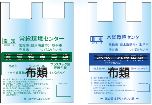
使用できる袋(透明)

使用できない袋 可燃ごみ専用袋・ダンボール箱 農業用袋・米袋・紙袋等の 透明な袋以外のもの