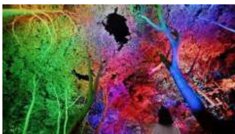
チームラボ《幽谷の呼応する森》©チームラボ