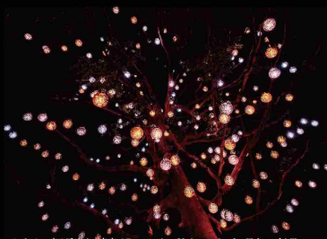
タブノキに宿る呼吸する宇宙 / Resonating Universe in the Tabunoki Tree