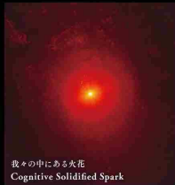
我々の中にある火花 Cognitive Solidified Spark