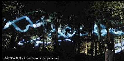
連続する軌跡 / Continuous Trajectories

The artworks explore how the existence of these forms can be used as they are to create a place where we can transcend the boundary in our understanding of the continuity of time and feel the long, long continuity of life. Using these existences that embody long periods of time as they are, we can experiment with transcending the boundary in our understanding of the long continuity of time and even today continue to accumulate meaning in this place.