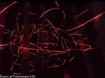
遺残する生命の痕跡 / Traces of Continuous Life