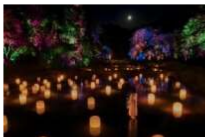
チームラボ《隠田跡》©チームラボ

※その他、案内事項は 公式 HP に掲載しておりますので、来場前にご確認ください。