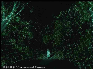
具象と抽象 / Concrete and Abstract