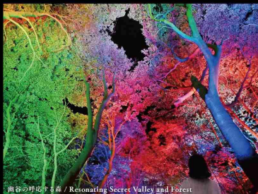
奥谷の呼吸する森 / Resonating Secret Valley and Forest