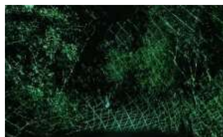
チームラボ《具象と抽象》©チームラボ