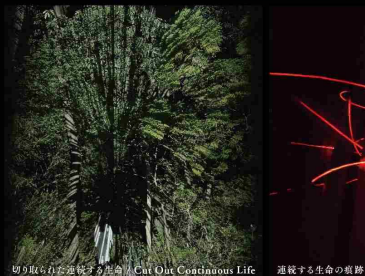
切り取られた連続する生命 / Cut Out Continuous Life