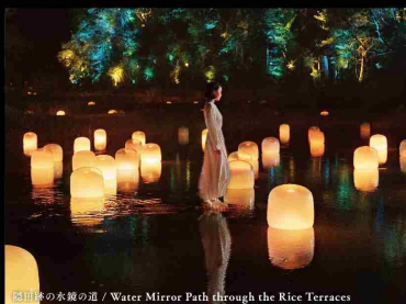
足音の水路の道 / Water Mirror Path through the Rice Terraces