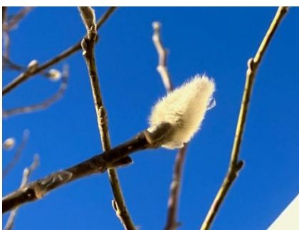
生徒用玄関前の「コブシ」花芽

会計報告については、本年度末のPTA監査を経て、次年度始めのPTA総会にてご報告させていただきます。