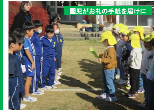
園児がお礼の手紙を届けに