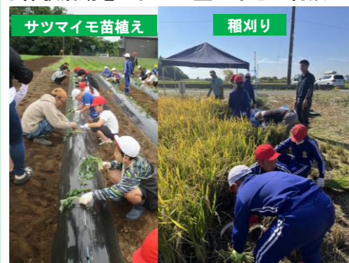
サツマイモ苗植え