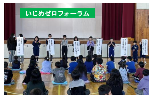
いじめゼロフォーラム