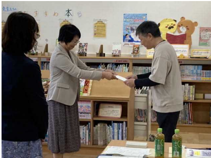
<学校運営協議委員の委嘱>

第2回目の学校運営協議会は、12月に予定されています。これからも、小絹地区は地域とともにある学校を目指して邁進していきます!!