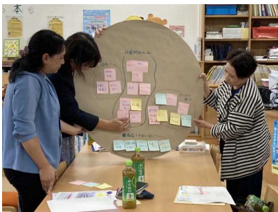
<「めざす小絹っ子像」話し合いの様子>