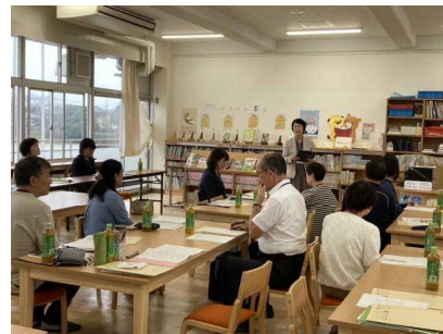
<町田教育長あいさつ>