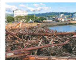
令和6年能登半島大雨災害(輪島市)