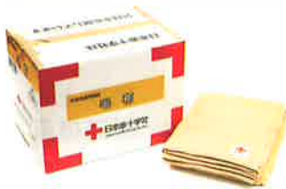
被災者配布用毛布 1人分