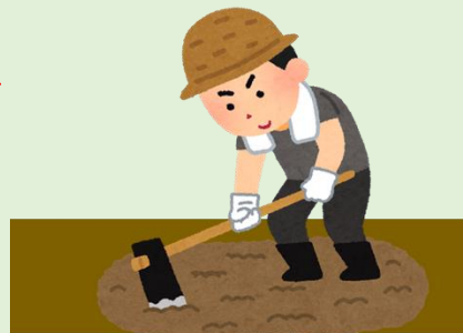
対策として耕作者に農地を貸し、作物を作付け