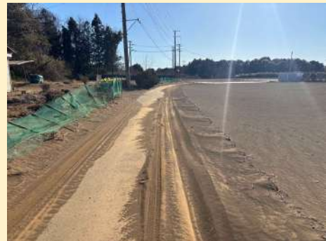
農地の表土が道路に流出した状態