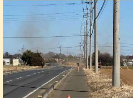
強風による砂ぼこりの様子