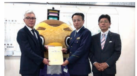
左から小田川市長、みらいりんどう主事、山下署長、横田議員

今後も、市民の皆さんからのご意見を大切にし、地域の交通安全を守る取り組みを継続していきます。