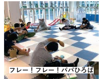
フリー！フリー！パパひろば