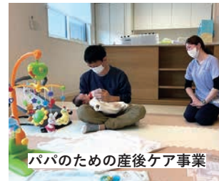
パパのための産後ケア事業