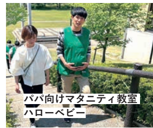
パパ向けマタニティ教室 ハローベビー