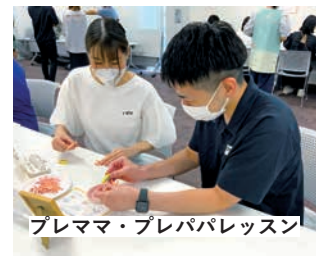
プレママ・プレパパレッスン