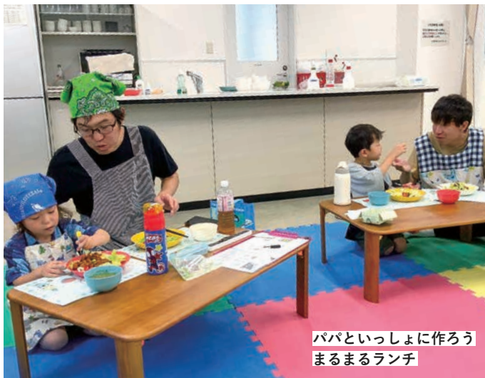
パパといっしょに作ろう まるまるランチ