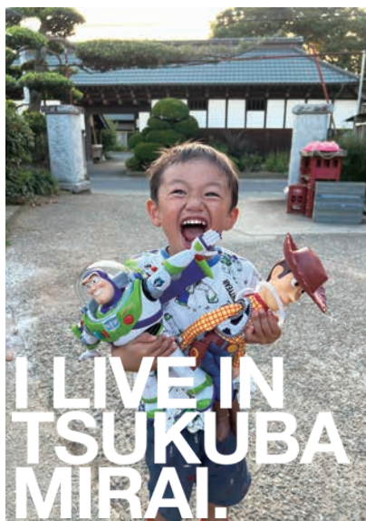
みんなの愛に囲まれて4歳になりました。