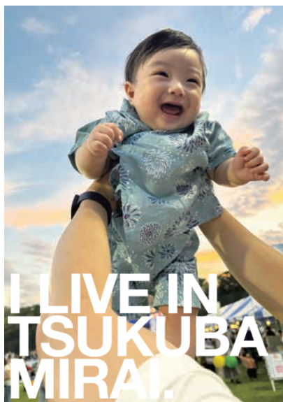
0歳初めての夏祭り、楽しかったね！