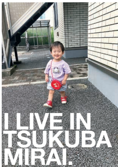
お気に入りのポシェット！