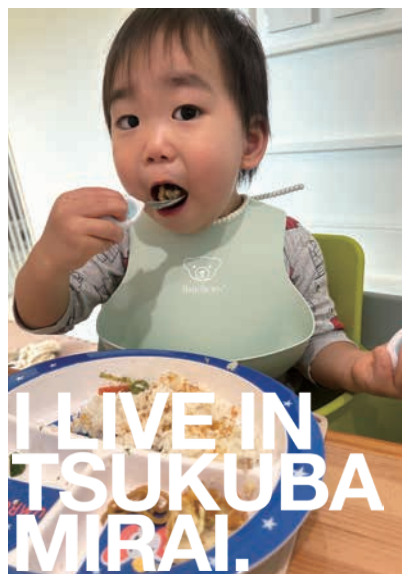
こども食堂ありがとうございます。美味しくいただいています！