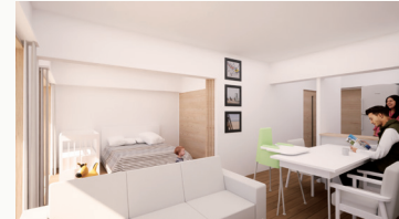
※写真は完成イメージです