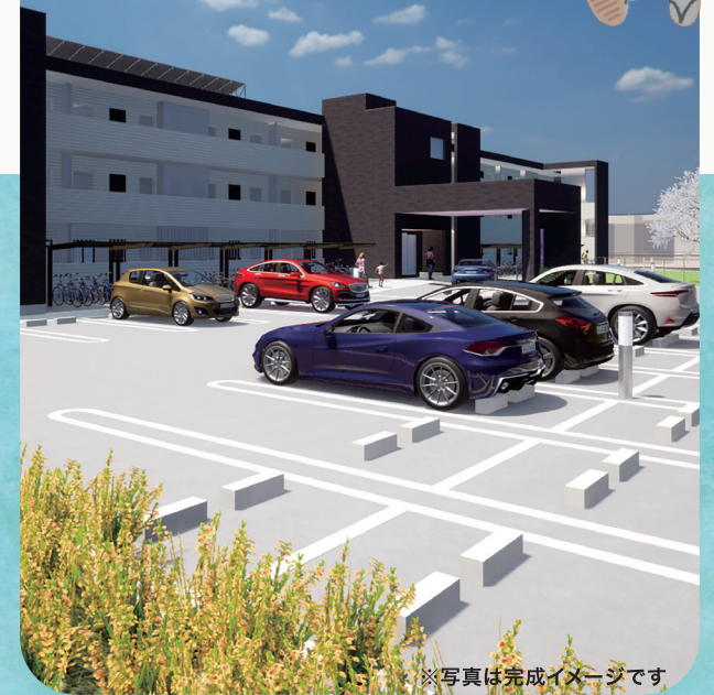
※写真は完成イメージです