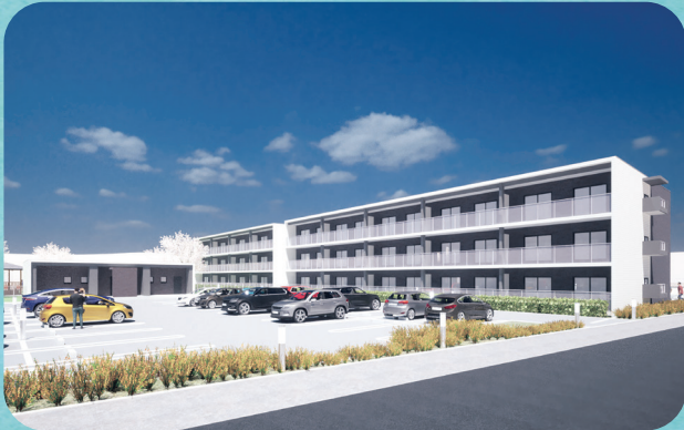
※写真は完成イメージのため実物とは多少異なります