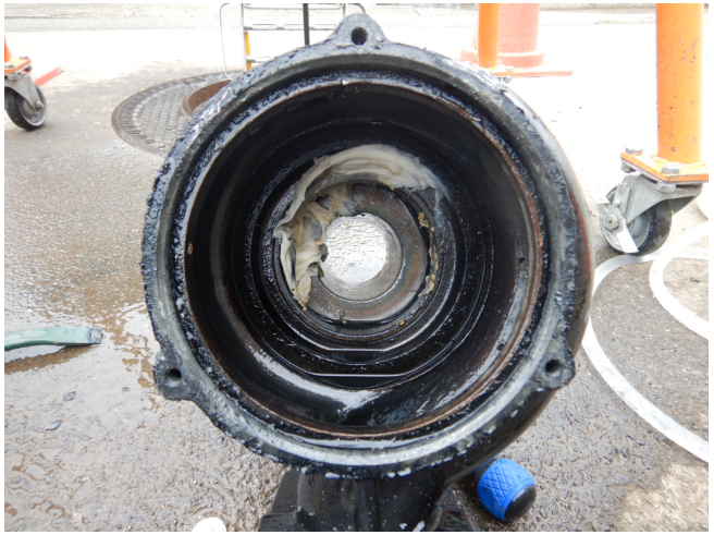
写真2 ポンプ分解による異物（ウェットティッシュ）除 去状況