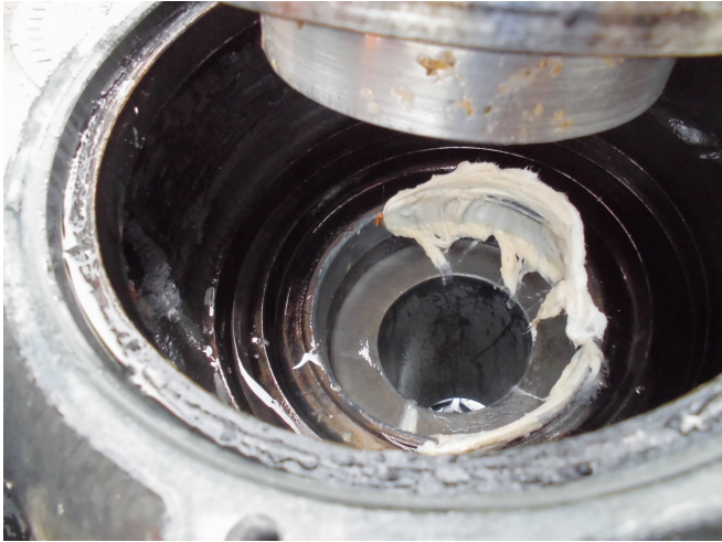
写真1 異物（ウェットティッシュ）流入による 詰まり発生状況