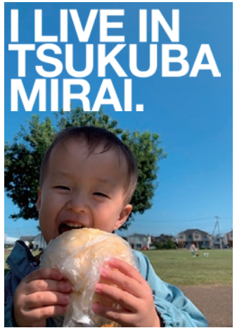
おじいちゃん、だいすき!