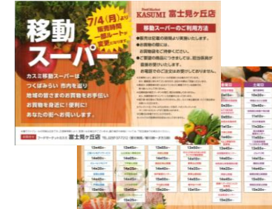
チラシの配布と市ホームページへ掲載