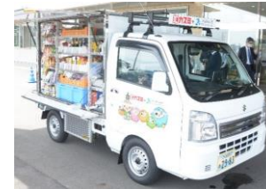
移動スーパー車両