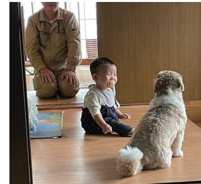
孫と愛犬を見守る祖父