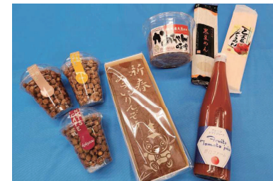
つくばみらい市の特産品