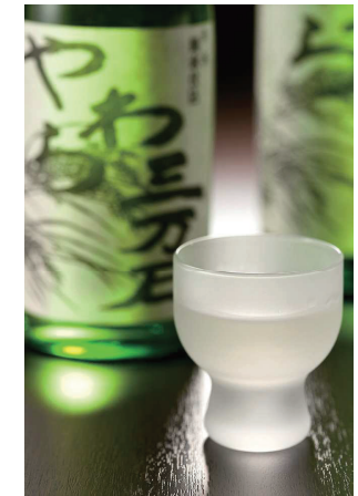
市内産米から作られた日本酒「やわらか石」