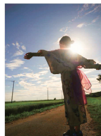
水稲を育てる田んぼの町、みらいつくば

企業や市内農業者などと連携して、就農相談、農地確保、農業機械の支援、技術研修などの継続した支援体制を構築することで新規就農を支援します。