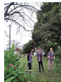
みんなで一緒に取り組む農業