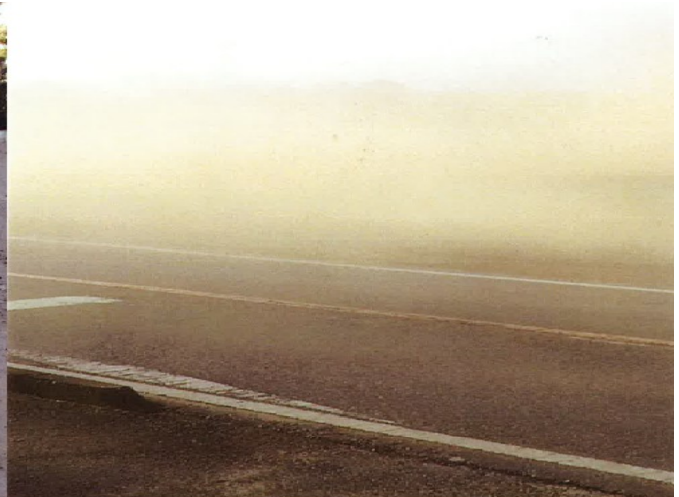
砂ぼこりで視界不良の状態