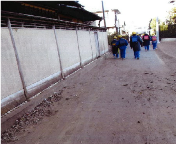
土砂が積もった通学路