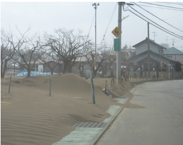
農地の表土が流出し堆積