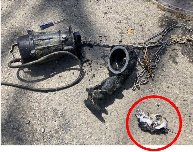
写真1 ポンプ分解による異物（タオル）除去状況