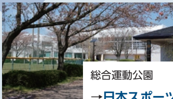
総合運動公園 →日本スポーツ振興パークみらい ※令和5年4月1日から