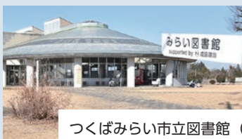
つくばみらい市立図書館 (本館) →みらい図書館 supported by 成島建設