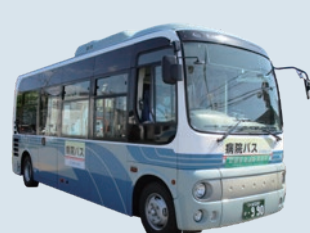
病院バスの運行 ※詳細は10ページ