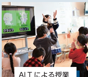
ALTによる授業 ※詳細は7ページ