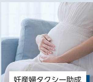
妊産婦タクシー助成 ※詳細は5ページ