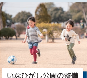
いなひがし公園の整備 ※詳細は9ページ