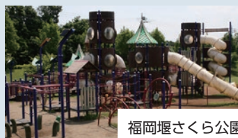
福岡塚さくら公園 →YAWARA 福岡塚さくら公園