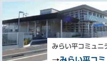
みらい平コミュニティセンター →みらい平コミュニティセンター supported by 成島建設