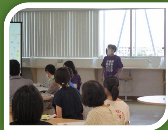
センターで開催した ワークショップの様子 (フレンドリーみらい主催)

広くて環境も整っているし、今では「市民センター」と言って場所を知らない人がいないので、ご案内もしやすくとても助かっています。