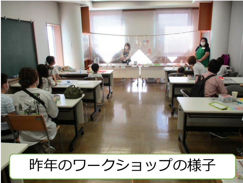
昨年のワークショップの様子