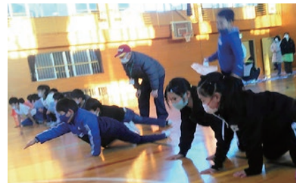
☎ 教育委員会生涯学習課 (内線 7304)