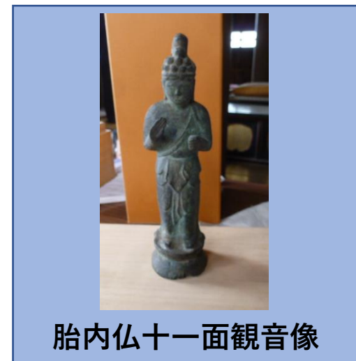
胎内仏十一面観音像