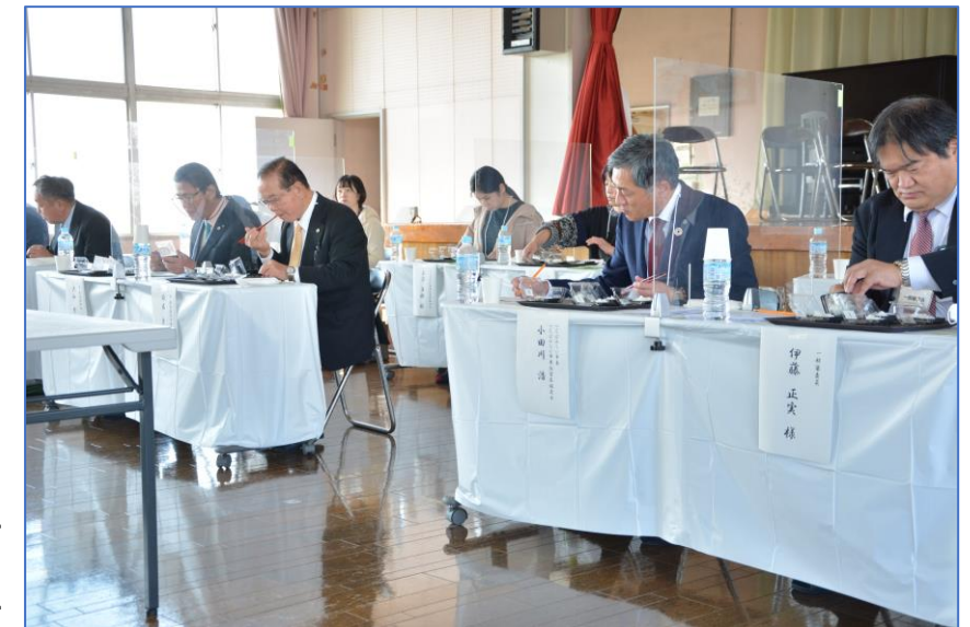
第1回コンテスト 官能検査状況