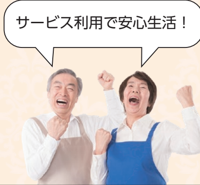
徘徊高齢者家族支援サービス