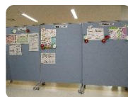
⑤市民活動紹介スペース