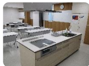
②団体活動室2 (調理設備あり)