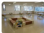
⑥交流スペース (キッズスペースあり)