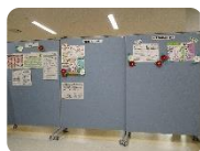
⑤市民活動紹介スペース