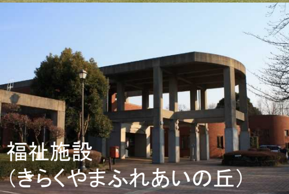
福祉施設 (きらくやまふれあいの丘)