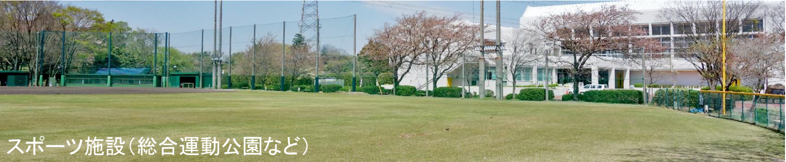
スポーツ施設(総合運動公園など)