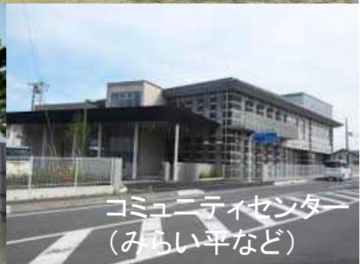
コミュニティセンター (みらい平など)