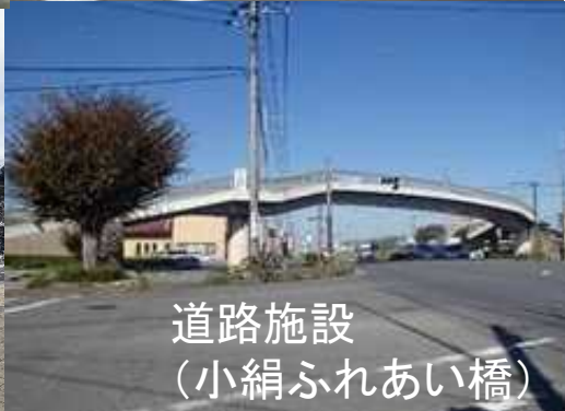
道路施設 (小絹ふれあい橋)