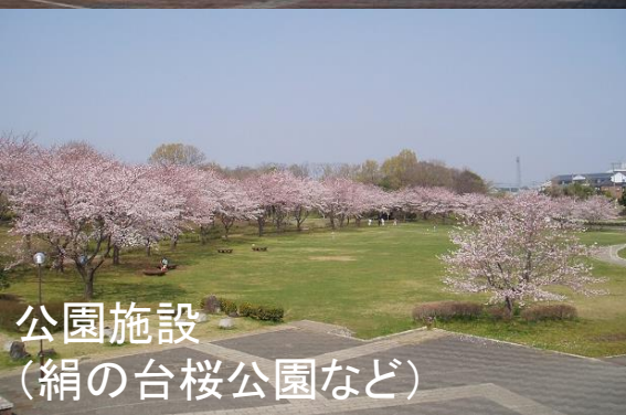
公園施設 (絹の台桜公園など)