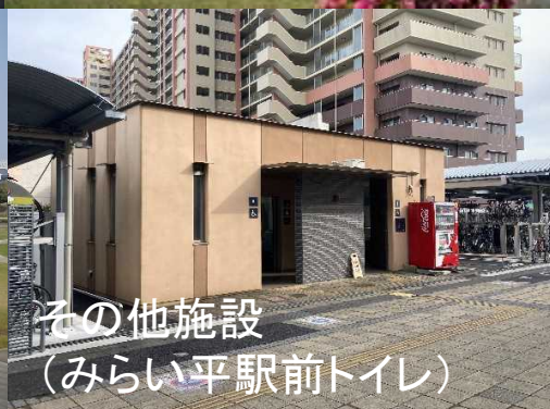
その他施設 (みらい平駅前トイレ)