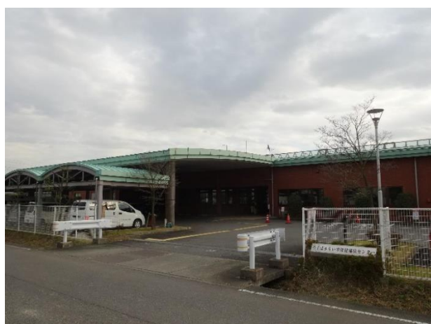
▲保健福祉センター外観