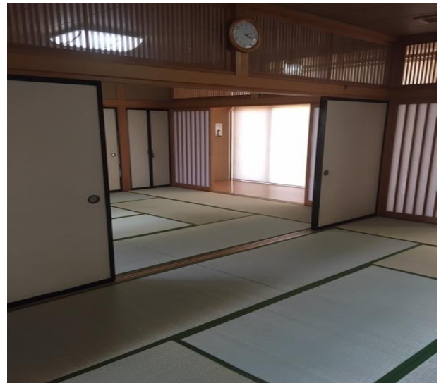
▲和室 2, 3