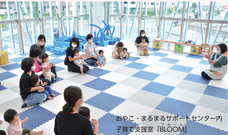
おやこ・まるまるサポートセンター内 子育て支援室「BLOOM」

妊娠した時からずっと、ママやパパと一緒に考え寄り添った相談・支援を実施しています。