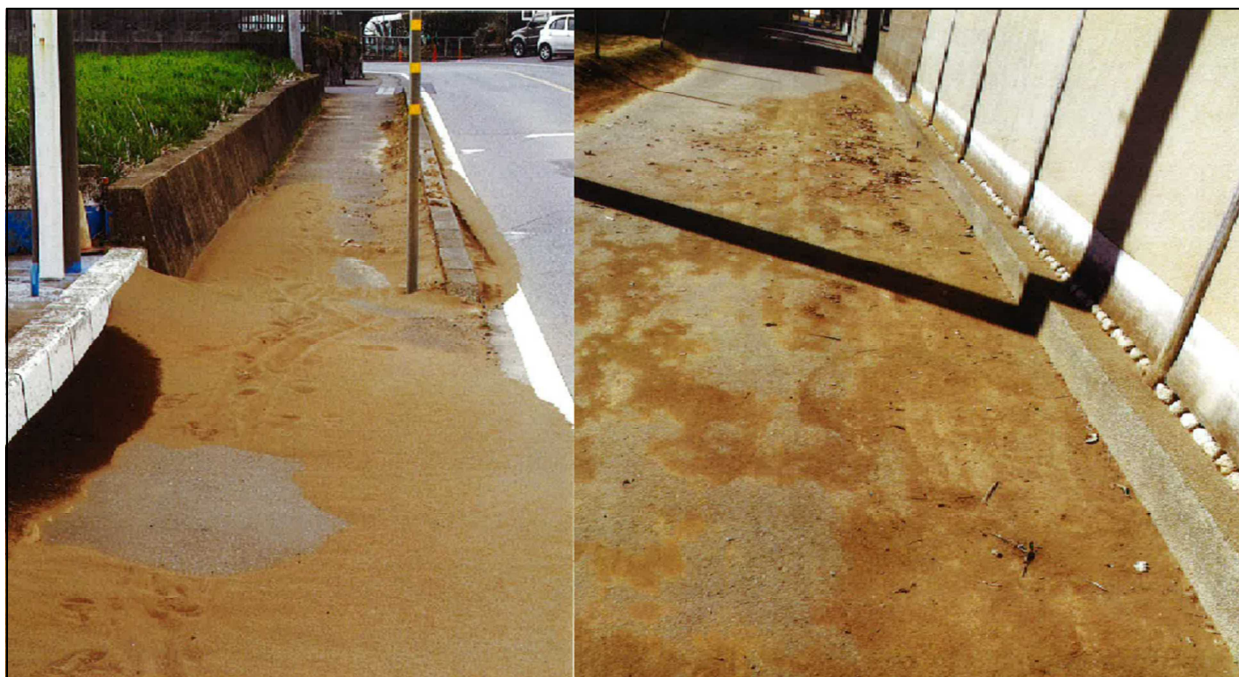
風下の道路に さじん 砂塵が土砂として堆積