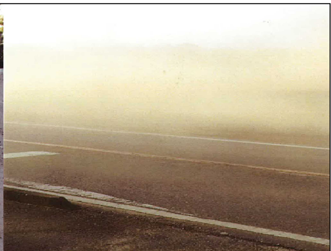
さじん 砂塵で視界が悪く、前が見えない状態