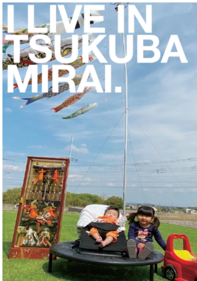
初節句おめでとう!