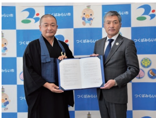
曹洞宗高雲寺の米沢住職と小田川市長

高雲寺は小張地区の高台に位置していることから、本協定により、風水害時における避難先確保に大きく貢献するものです。