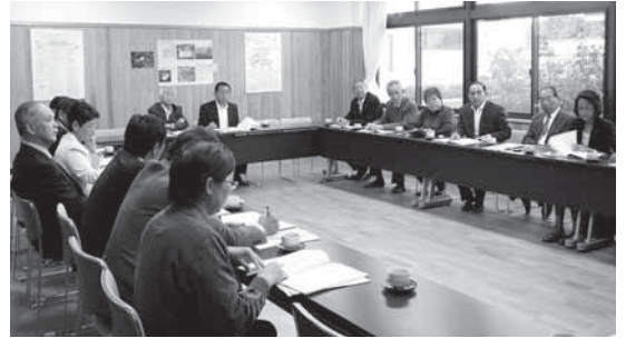
牛久市立ひたち野小学校での研修の様子

平成24年度は、現在、みらい平地区に（仮称）陽光台小学校の建設・設計が進められていることから、平成24年10月24日（水）、先進事例視察として平成22年4月に開校した牛久市立ひたち野うしく小学校を訪問し、学校施設の建設経過や施設概要の説明・質疑、見学などを行い、今後の議案審議の参考にと視察研修会を実施しました。