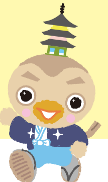
茨城県つくばみらい市 公式マスコットキャラクター みらいりんぞう

ちょっとしたあなたの手助けが、障害や病気のある方が困っている時の安心につながります。