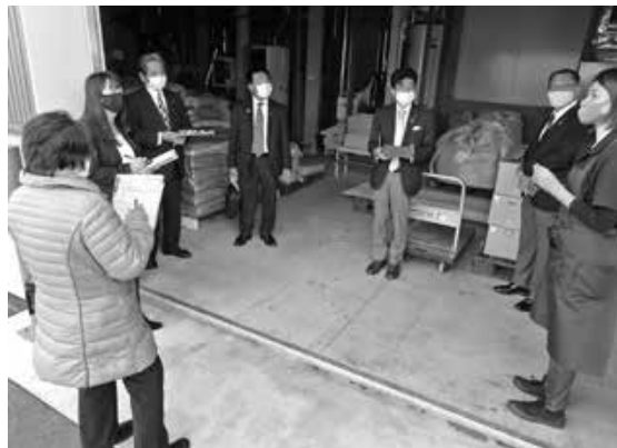
福井市での視察風景