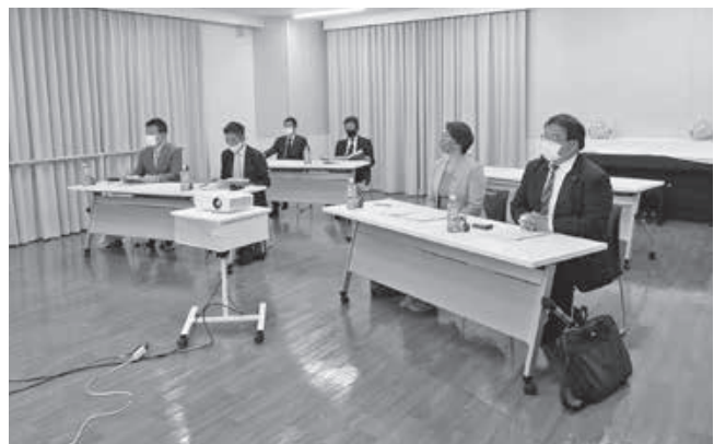
滝沢市での視察風景