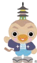
つくばみらい市 イメージキャラクター 「みらいりんぞう」

「議会だより」についてのご意見・ご感想をお寄せください。今後の本誌編集の参考にさせていただきます。また、議会についてのご意見等ありましたら併せてお聞かせください。