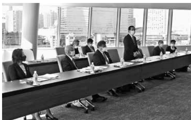
横浜市での視察風景