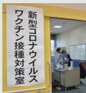
保健福祉センターに設置された 対策室

ワクチンが国で承認され供給される時は、円滑に接種が開始できるよう準備を進めるとともに、接種の推進およびワクチン接種に関わるさまざまな相談やお問い合わせにスムーズな対応をします。