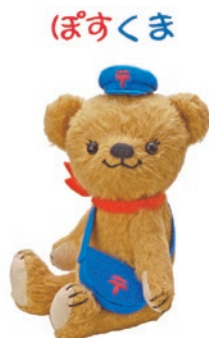
© JAPAN POST Co., Ltd. ぽすくまは日本郵便のキャラクターです。

新設される郵便局の名称は「みらい平郵便局」。みらい平市民センターと同じ建物の1階に設置され、開局日も同センターと同日の8月24日(火)の予定です。