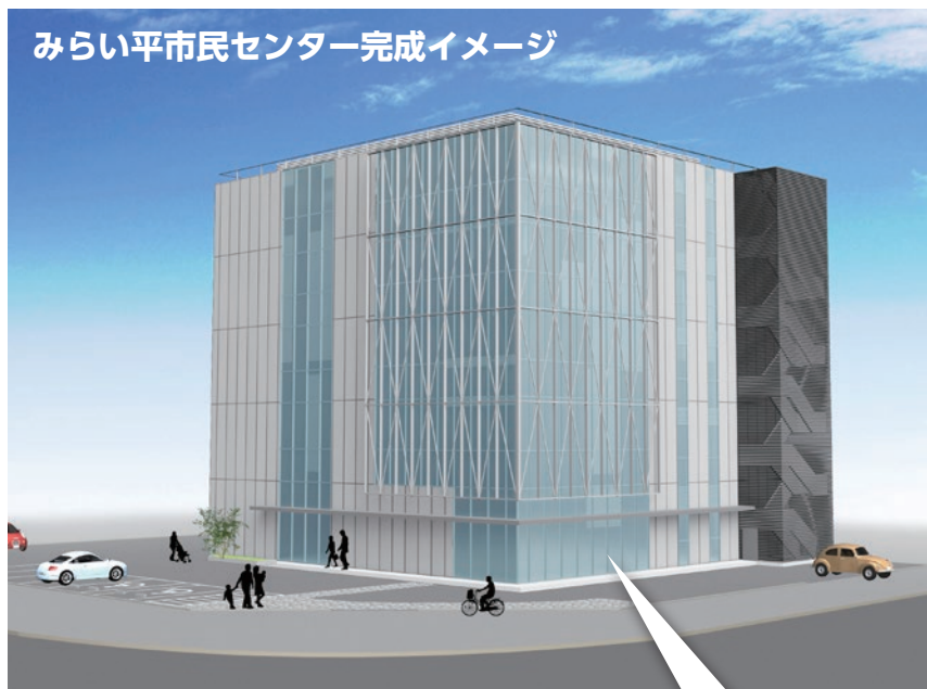
みらい平市民センター完成イメージ

なお、開所時間や業務内容などの詳細につきましては、決まり次第、「広報つくばみらい」や市ホームページでお知らせします。