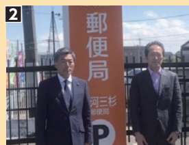
2: 生沼茨城県西部地区連絡会統括局長へ要望 (平成31年5月)