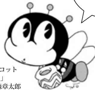
生涯学習のマスコット 「マナビィ」 デザイン：石ノ森章太郎