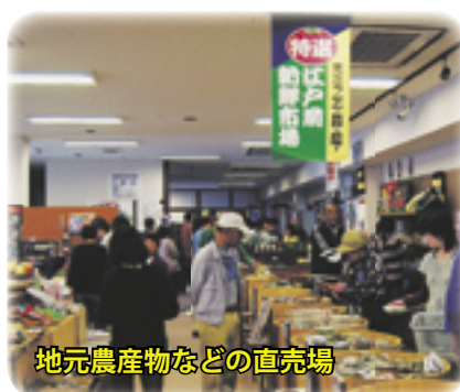
地元農産物などの直売場