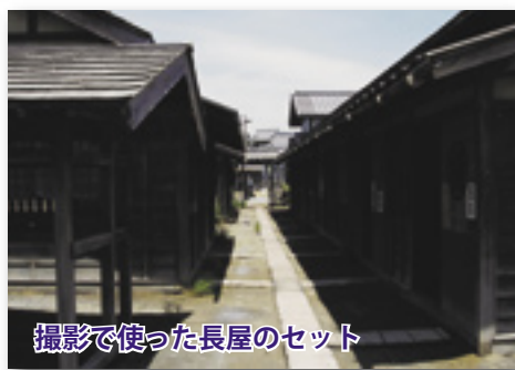
撮影で使った長屋のセット