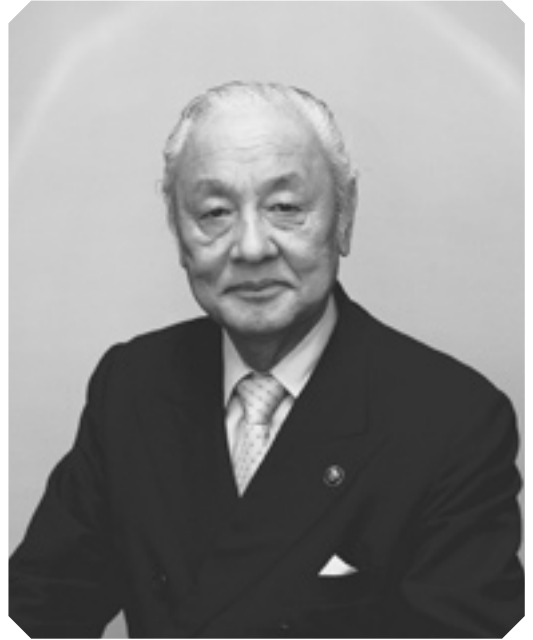
つくばみらい市長 飯島 善 いじま ぜん