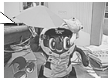
らいぶらりあんスピーフィ

図書館URL：http://www.city.tsukubamirai.lg.jp/library/ 「蔵書検索」「新聞記事」 見るつくばみらい市&TX」他 図書館E-mail：library01@city.tsukubamirai.lg.jp