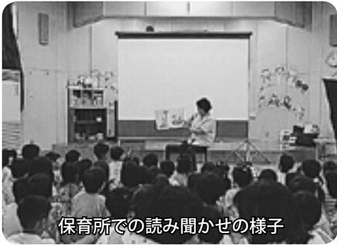
保育所での読み聞かせの様子