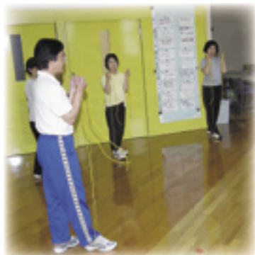
▶ ミニ教室の様子。（写真はチューブ運動）

▼ 「コスモドクター」で休憩中。全身に9,000ボルトの電子が入り、新陳代謝を活発にして自然治癒力を高めます。もちろん体には無害です。