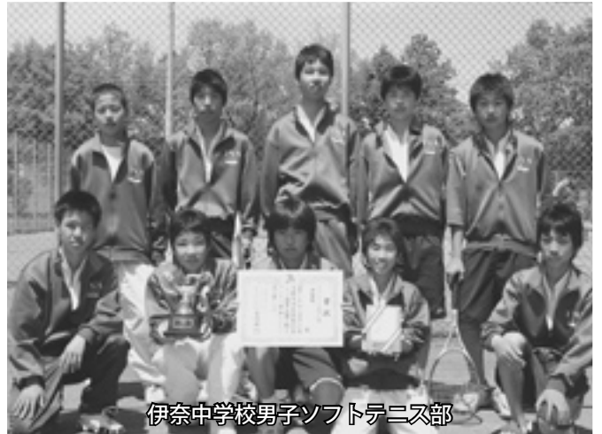
伊奈中学校男子ソフトテニス部

ソフトテニス 4月29日・5月3日 卓球 5月3日 野球 5月5日・6日 バレーボール 5月20日・21日 バスケットボール 5月20日・21日