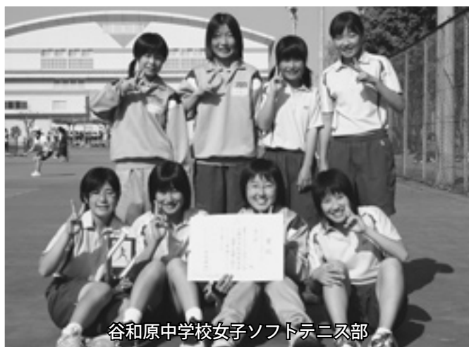
谷和原中学校女子ソフトテニス部