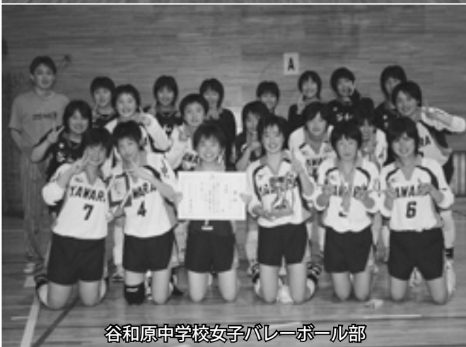
谷和原中学校女子バレーボール部