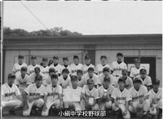
小絹中学校野球部