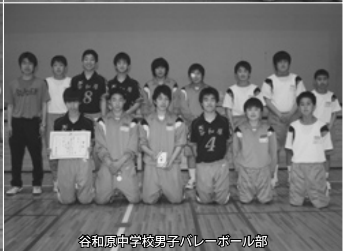
谷和原中学校男子バレーボール部