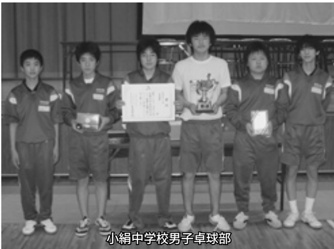
小絹中学校男子卓球部