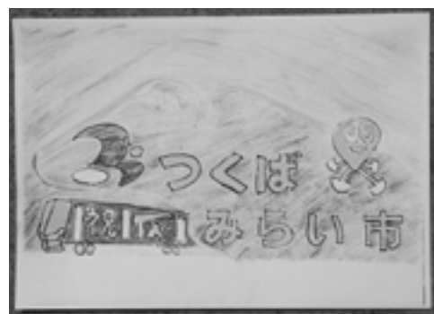
完成予定図です。背景には筑波山も。

会もだいぶ大きくなりました。基礎ができ、行政に頼りきりでなく、独立してやっていく会になりました。今は、みらい平周辺の新住民との交流も考えており、ネットワーク作りにも動いています。私たち「古瀬の自然と文化を守る会」は、遊休農地の利用見本であるという自負があります。県北は観光地ですが、県南、特にこの辺は観光地ではありません。現状の土地を使ってどう人を呼ぶかが、これからの課題だと思います。今後地域発展のため、知名度アップのために、少しでも力になれば幸いです。