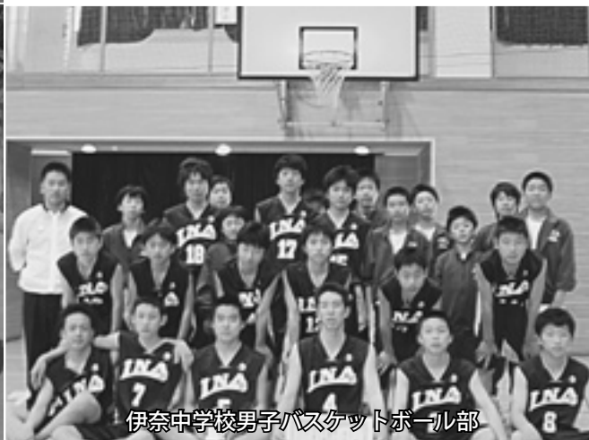
伊奈中学校男子バスケットボール部