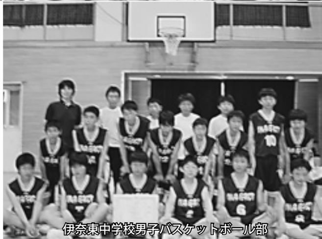
伊奈東中学校男子バスケットボール部