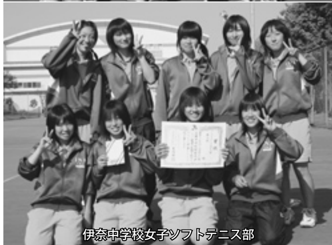
伊奈中学校女子ソフトテニス部