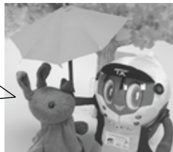
らいぶらりあんスピーフィ