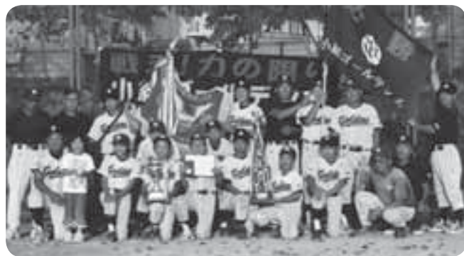
全員野球！小絹ゴールデンズ