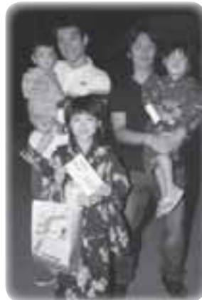
浴衣コンテスト入賞者のみなさん