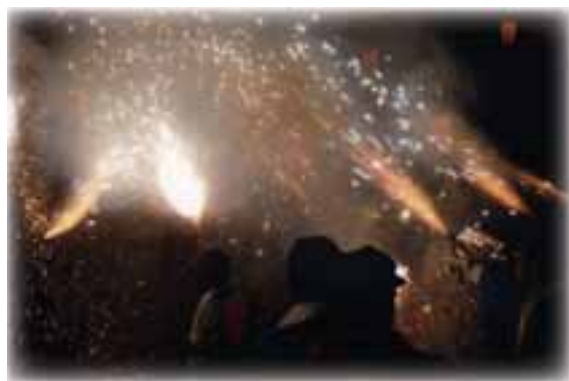
繰り込み(清めの花火)の様子。

今年はNHK(BSハイビジョン、茨城デジタル放送)でテレビ放送され、また9月2日には、きらくやま世代ふれあいの館で特別上映会も行われ、大きく取り上げられました。