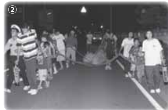
② 下島地区 盆綱

この他にも「珍しい行事」や「伝統的な行事」は、地域でいろいろあることと思います。ぜひ情報をお寄せください。