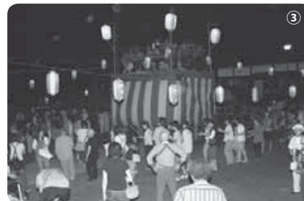
③ やぐらを囲んで盆踊り