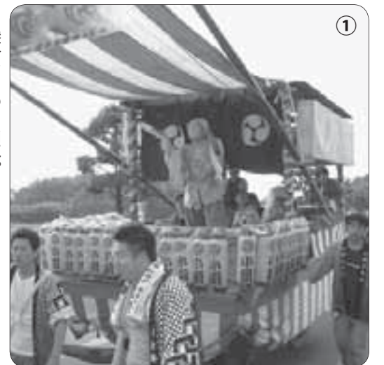
① 集落をまわる山車。新宿神楽が見事な舞いを見せる。

8月13日、下島地区、伊丹地区において「盆綱」が行われました。盆綱は、子どもたちがへびのような長い綱を引きながら、集落をまわる伝統的な行事です。集落内では、子どもたちの「ワッショイ! ガッショイ!」という元気な声が響き渡りました。