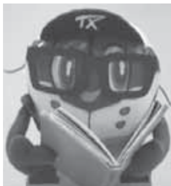
らいぶらりあんスピーィ

図書館休館日 ・毎週月曜日 ・資料整理日(31日) ・体育の日振り替え(10日) おはなし会 10月28日(土) 午前11時～ 幼児～小学校低学年 読み聞かせ会(虹の会) 10月14日(土) 午後2時～ 小学生まで 開館時間 午前10時～午後6時 図書館への問い合わせ ☎58-3710