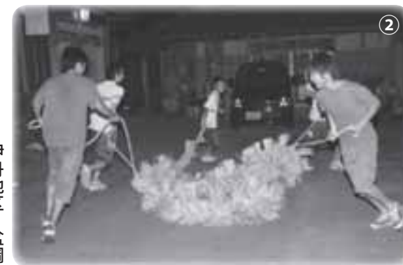
② 伊丹地区 盆綱