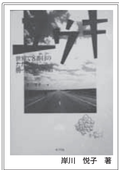
岸川 悦子 著