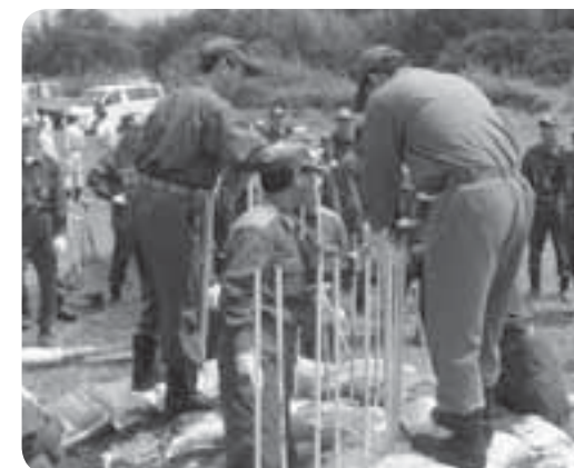
月の輪工法実施の様子

7月30日、杉下地先小貝川右岸(谷原大橋下流約200m付近)において、つくばみらい市水防訓練が行われました。出水期にあたり、水防作業の技術の習得、能率向上を目的として行われたものです。