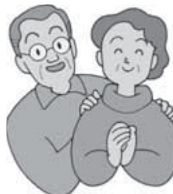
高齢者の生活をサポートします