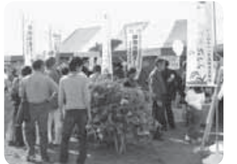
地元特産品の物産展

10月26日、茨城県武道館で行われた平成18年度茨城県警察柔道・剣道大会が行われ、常総警察署が第二部（中規模署の部）において、柔道・剣道とも優勝しました。おめでとうございます。