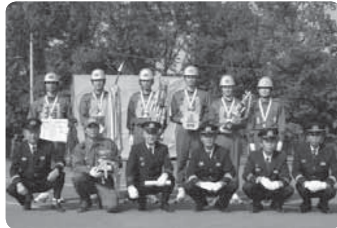
第5分団優勝おめでとう！

この大会を通して養われた消防精神を、市民の安全確保のために発揮し、市民が安心して暮らせる災害に強いまちづくりを目指します。