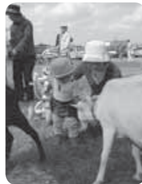
動物とのふれあい

10月28日、みらい平駅前特設会場において開催された「みらい平まつり」。天気にも恵まれ、多くの家族連れなどでにぎわいました。数々の物産展やイベントが行われ、来場者は約1万人となりました。