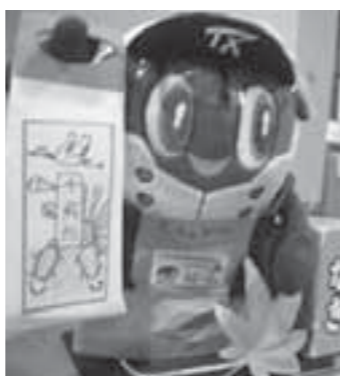
らいぶらりあんスピーフィ