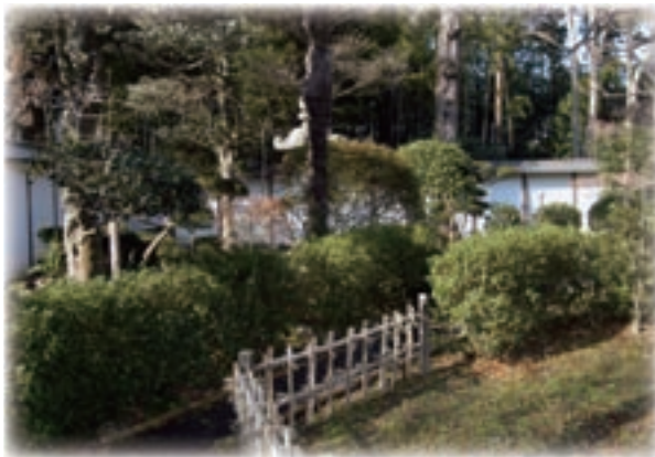
◀自然観察路。梅や竹など、生活に結びついた樹木が多く見られます。