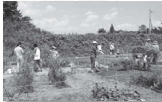
▲写真は、県主催の野菜作り体験イベントinみらい平