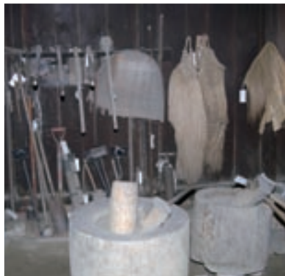
▼先人の生活文化を語る貴重な調度品。