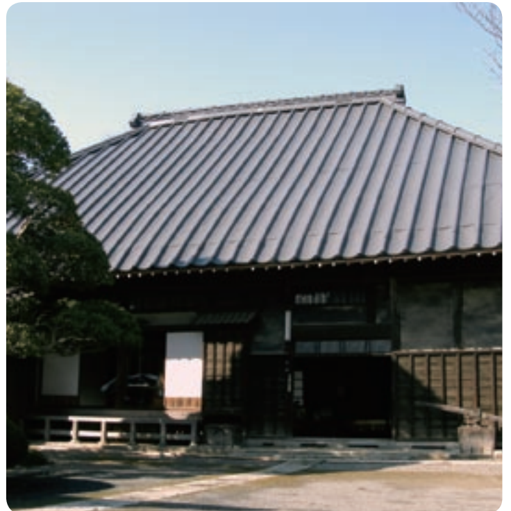
▲母屋。座敷に上がることもできます。

敷地内には母屋・長屋門・蔵などが建てられています。堂々とした屋敷構えは、江戸時代の豪農名主、明治初期の戸長宅としての風格を示しています。敷地全体は自然観察路として整備され、四季折々の草花、野鳥、虫などを見ることができます。館内では、当時の生活をうかがい知ることができるように、生活具をもとの場所にそのまま展示してあります。また史料収蔵庫には江戸時代初期からの文書類が5,000点以上保管されており、その一部が展示公開されています。