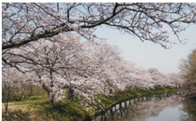
伊奈神社の近くには、桜の名所である「福岡堰」が。もうすぐ桜のシーズンです。茨城百景にも数えられる見事な桜並木をご堪能ください。