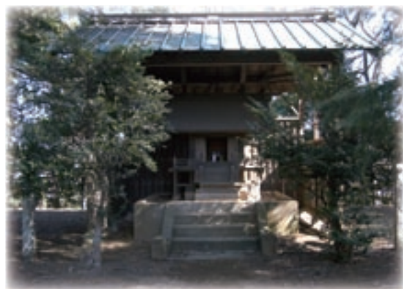
奥にひっそりとたたずむ本殿