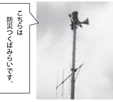
こちらは防災つくばみらいです。

4月からは、市内全域に設置してあります屋外子局(スピーカー)の整備工事が始まり、工事の状況により、一時的に数日間運用が停止します。その場合には、運用停止の日程について、あらかじめ行政協力員さんを通じて回覧などでお知らせします。 大変ご迷惑をおかけしますが、ご協力をお願いします。