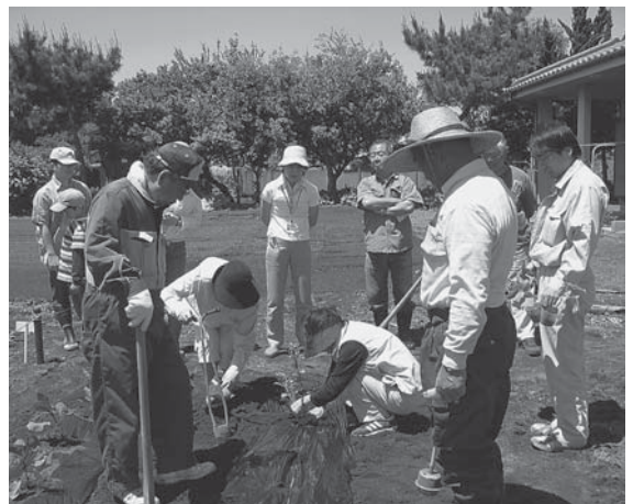
【栽培講習会の様子】