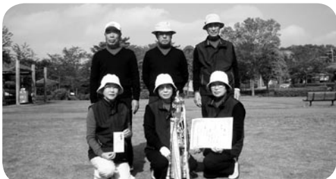
優勝したグリーンズチームの皆さん(写真3)