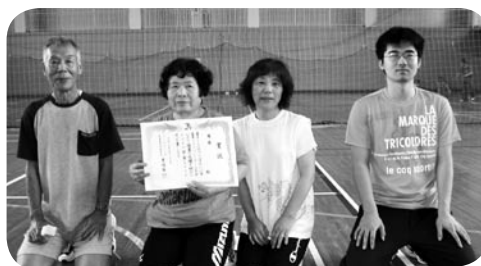
優勝したフクちゃんの皆さん(写真6)