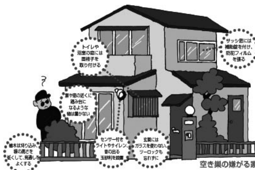
空き巣の嫌がる家