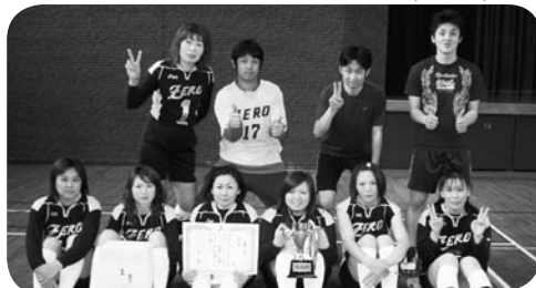
優勝したZEROの皆さん(写真5)