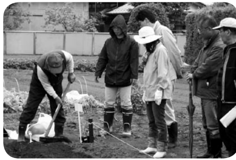
市民農園栽培講習会のようす

※ 小張市民農園の利用を希望される場合は、谷和原庁舎農政課（☎58・2111内線8152・8154）までお問い合わせください。