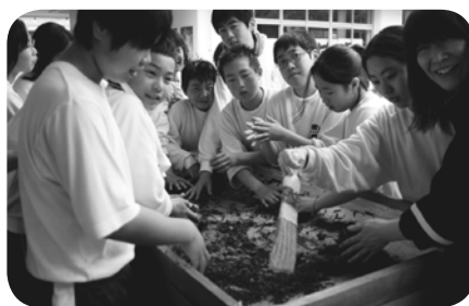
根氣よく手もみをして