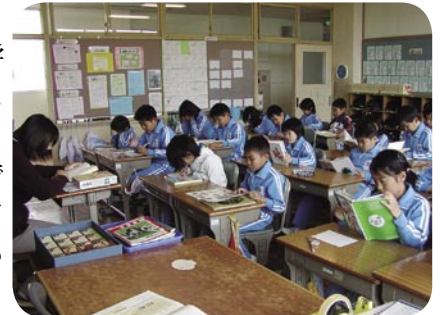
あいさつ・読書のようす

谷原小学校は、現在7学級で児童数148人が在籍しており、総勢18人の教職員で指導にあたっています。非常勤T T講師、特別支援教育支援員、理科支援員が配置されましたので、児童一人一人へのきめ細かな指導やより専門的な指導の充実が図れると考えています。