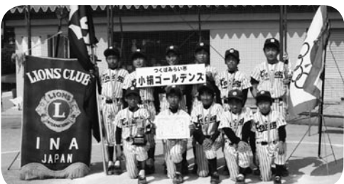
優勝した小絹ゴールデンズの皆さん(写真4)