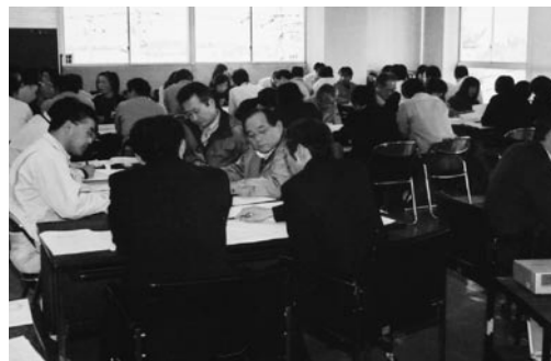
1月に実施した考課者に対する研修会のようす