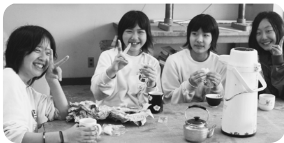
つみたてのお茶に満足な笑顔