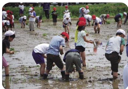
全校生徒で田植え

4つ目は、「家庭や地域との連携を深め、地域に根ざした教育体制づくりに努める」ことです。今年度は、5月8日に地域の方々にお手伝いをしていただき全校児童で田植えを行いました。1年生と6年生、2年生と5年生、3年生と4年生が組んで一緒に植えました。6年生は、6回目の田植えということもあり、「米プロ」の方からも褒めの言葉をいただきました。