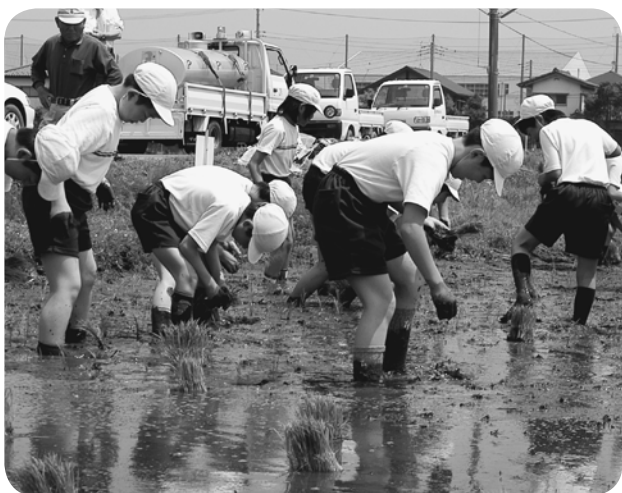
どろんこで田植え体験だ

また、自分たちで作ったお米は秋に収穫され、学校給食に出される予定です。 実りある秋となればよいですね。