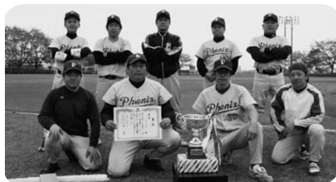
優勝したフェニックスの皆さん(写真1)

※紙面の都合上、投稿いただいた情報が必ずしも掲載できるとは限りませんので、ご了承ください。