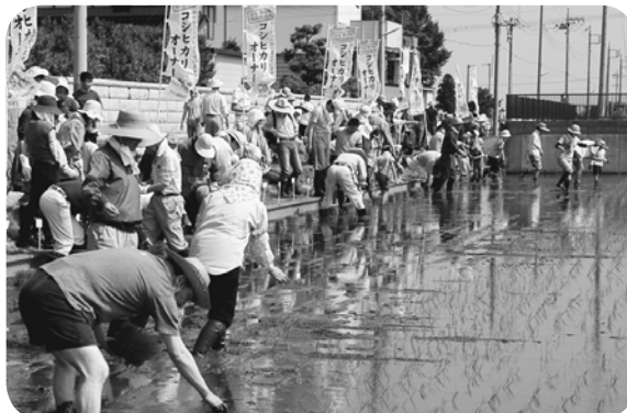
米づくりの大変さと楽しさを味わうオーナー家族の皆さん

この事業は今回が1回目。地元産のおいしいお米を広く知ってもらおうと始めたもので、コシヒカリオーナーの募集をしたところ、当初予定の23区画から80区画に増やすほどの人気で、県内外から多数の応募がありました。