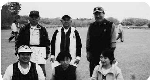
グラウンド・ゴルフ大会表彰者の皆さん(写真2)