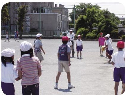
ドッジボールで体力向上

1つ目は、「基礎学力を身につけ、自ら学ぶことのできる児童を育成する」ことです。本校では、基礎基本の定着と学習意欲の向上を図るため国語と算数の「級別検定」を行っています。学習すればただそれだけが結果となって表れることを児童は自覚し、努力をするようになってきています。また、心と脳の活性化を図るため「毎朝10分間の読書」に取り組んでいます。