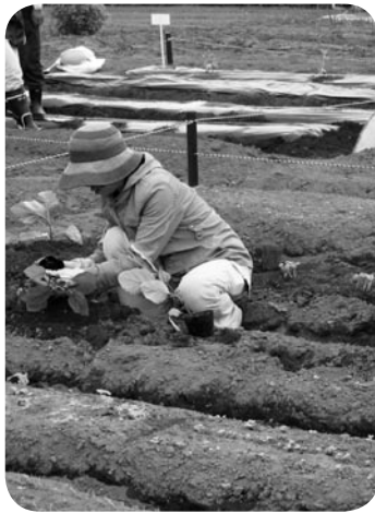
収穫が楽しみですね

区画には、まだ若干の空きがありますので、皆さんも土や緑に親しみながら、農作業による健康づくりや新鮮野菜を収穫できる楽しみとして「小張市民農園」を利用してみてはいかがでしょうか？