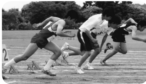
市立中学校陸上競技大会

中学校の代表が参加した陸上競技大会が、常総運動公園を会場に開催されました。 競技は、400mリレー、100m走、走り高跳び、走り幅跳び、ボールスロー、砲丸投げなどを種目として、選手たちは日ごろの練習の成果を十分に発揮して自己記録を更新しようと、一生懸命に取り組んでいました。 また、応援する児童や生徒のほか、保護者も多数かけつけ、熱のこもった声援を送っている姿がみられました。