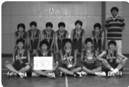
バスケットボール男子の部 準優勝 谷和原中学校