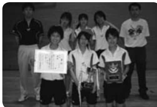
卓球女子の部 優勝 小絹中学校Aチーム