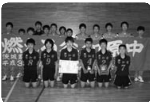
バレーボール男子の部 第3位 谷和原中学校