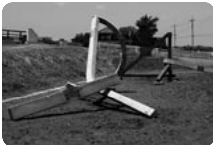
自然の中に溶け込む大型彫刻

作品には、「現代美術の祭典」で大賞を受賞した作品を含んだ2点と、日本大学の学生による作品1点が展示さ