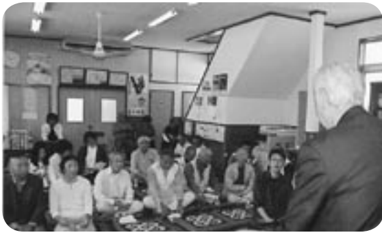
活発な意見交換が行われた対話集会

市では皆様の意見を市政に反映するため、今後も、このような対話集会を続けていきます。対話集会に関する場合は、伊奈庁舎秘書広聴課（内線1201～1203）にお問い合わせください。