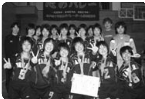
バレーボール女子の部 準優勝 谷和原中学校

大健闘し、優秀な成績を収めました。 上位3位まで入賞した市内 中学校について紹介します。