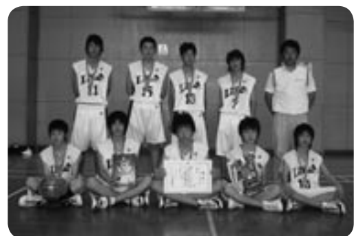
バスケットボール男子の部 優勝 伊奈中学校