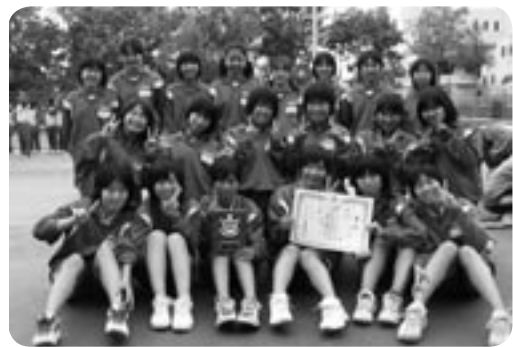
ソフトテニス女子の部 第3位 小絹中学校