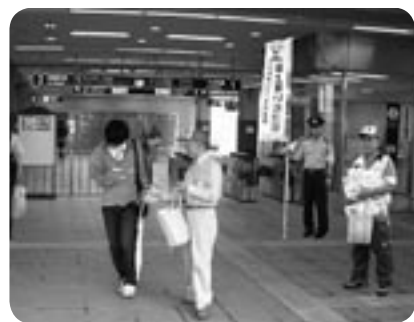
駅前で行われたキャンペーン

「6」と「9」の語呂にちなんで制定された「ロックの日(6月9日)」に、みらい平駅周辺で防犯キャンペーンが行われました。