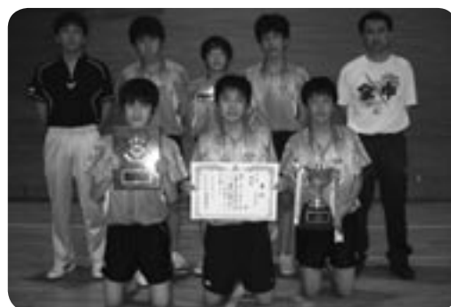
卓球男子の部 優勝 小絹中学校Aチーム