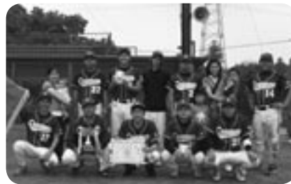
コスモスのみなさん

●市春季野球大会 期日 5月18日、6月1日、8日 優勝 コスモス 準優勝 Bull Dog 第3位 イエローパンサー つくばみらい市役所