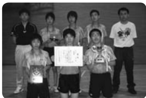
卓球男子の部 準優勝 小絹中学校Bチーム

大健闘し、優秀な成績を収めました。 上位3位まで入賞した市内 中学校について紹介します。