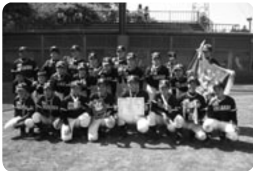
野球の部 優勝 伊奈東中学校

5月3日から24日にかけて、「平成20年度つくばみらい市近隣中学校球技大会」が行われました。 市内および近隣中学校のあわせて54校、172チームが参加し、元氣いっぱいの中学生在が全力で最後までプレーしていました。 実施された種目は「ソフトテニス」「卓球」「野球」「バレーボール」「バスケットボール」の5種目で、市内の中学生が