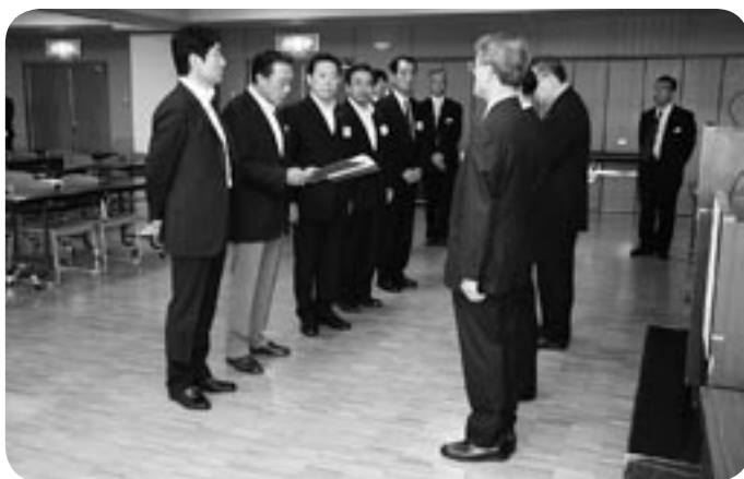
(写真は左から、つくば市長、守谷市長、流山市長 つくばみらい副市長、柏市都市計画部長)

東京駅延伸により、利便性が向上し、沿線地域での定住化促進に大きく寄与することが期待されています。