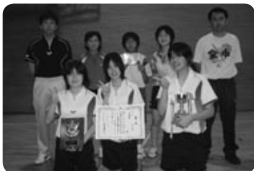
卓球女子の部 準優勝 小絹中学校Bチーム