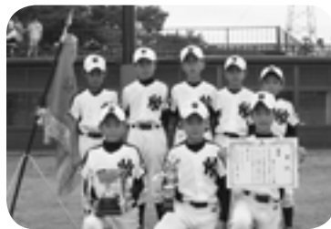
優勝した豊ナインズの皆さん