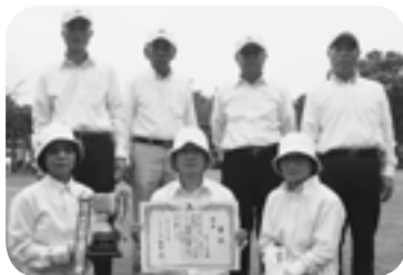
優勝したグリーンズチームの皆さん

期日 9月28日 結果 優勝 豊ナインズ 準優勝 板橋ファイターズ 第3位 小絹ゴールデンズ