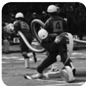
日ごろの訓練の成果を発揮！

10月19日、第59回茨城県消防ポンプ操法大会筑波地区大会が、つくば市のカスミつくばセンター駐