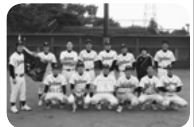
優勝したヤイターズの皆さん

期日 10月12日 結果 【1・2年の部】 優勝 YFC小絹 準優勝 YFC谷原 【3・4年の部】 優勝 板橋FC 第3位 谷和原F 【5・6年の部】 優勝 YFC小絹 第3位 YFC谷和原