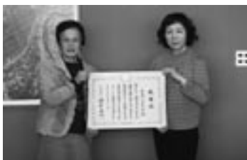
「虹の会」の皆さん、おめでとうございます

会の活動は平成6年からで、市内各小学校などでの児童を対象とした読み聞かせ活動や、老人福祉施設などに outgoing、高齢者への読み聞かせ活動を定期的に実施しています。今回、これらの活動が評価され、受賞されたものです。