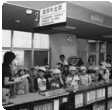
ここは、何をするとところだろう？