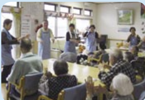
高齢者福祉施設でのボランティアの様子

そのため全員でどんな遊びを取り入れたら良いか、興味のある体験はどんなものかと考えるのも楽しいです。