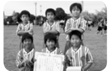
1・2年部門優勝のYFC小絹の皆さん