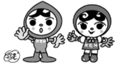
人権イメージキャラクター 人KENまもる君 人KENあゆみちゃん