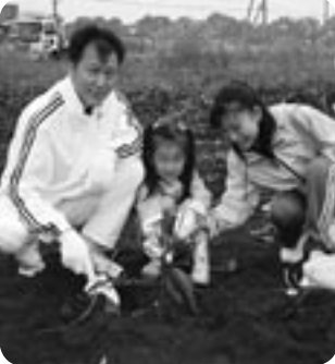
大きなおいもがとれたよ

当日は、雨模様のあいにくの天候でしたが、子どもづれの家族をはじめ約600人の参加者からは、掘り出したさつまいもに大きな歓声があがっていました。