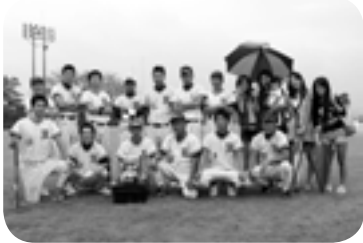
優勝したリリーズの皆さん