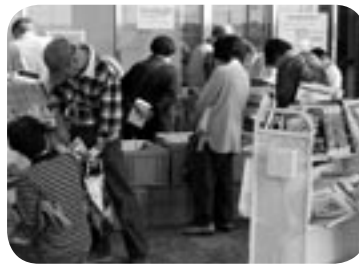
にぎわった本のリサイクル市

会の活動は平成6年からで、市内各小学校などでの児童を対象とした読み聞かせ活動や、老人福祉施設などに outgoing、高齢者への読み聞かせ活動を定期的に実施しています。今回、これらの活動が評価され、受賞されたものです。