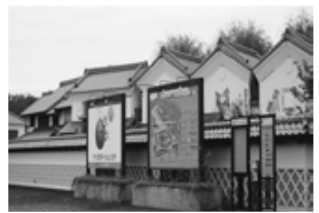
ワープステーション江戸

第1回の今回は、「メディアパークシティ整備構想」の内容と「㈱メディアパークつくば」の解散に至る経緯、今後の当事業の進め方についてお知らせします。