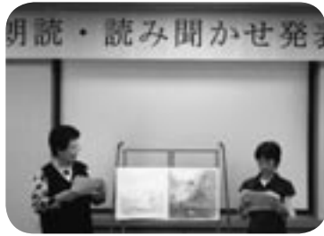
大型絵本の読み聞かせをする出演者

10組の出演者の方が工夫を凝らした発表を行い、発表会を聴きにきた方とともに楽しい時間を過ごすことができました。参加者からは「朗読・読み聞かせは、子どものみならず、大人が聴いても楽しい。生の声で想像が増しました。」などの感想がありました。