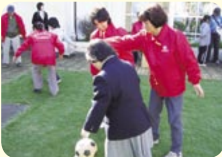
伊奈養護学校「伊奈養祭」でお手伝い